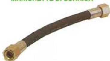
MANICHETTE DI SCARICA