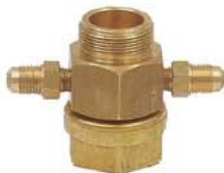
ART. CODICE 1778 INTCO