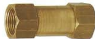
ART. CODICE TIPO 1733 VNRS34 3/4" FF 1734 VNRS 1" FF