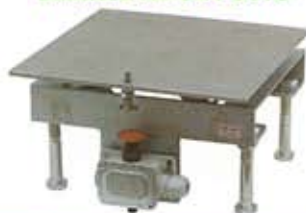
BILANCE AD UN POSTO