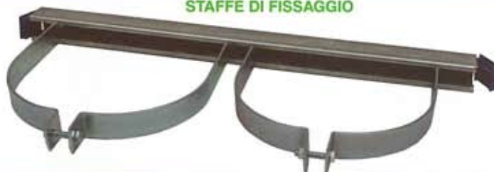
STAFFE DI FISSAGGIO