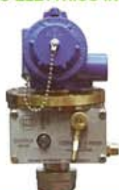
COMANDO ELETTRICO IN ADPE