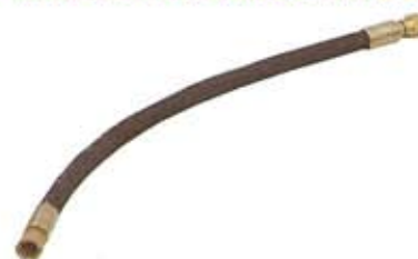
MANICHETTE DI SERVOCOMANDO