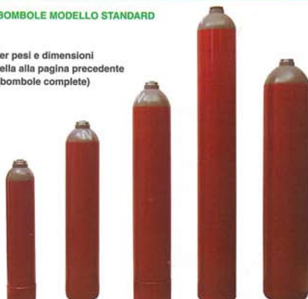
Art. 1711 Art. 1701 Art. 1703 Art. 1705 Art. 1715

Per pesi e dimensioni vedi tabella alla pagina precedente (bombole complete)