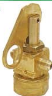
ART. CODICE TIPO 1855 CMP tradizionale