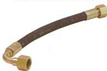
MANICHETTE DI SCARICA