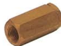
VALVOLA DI SFIATO