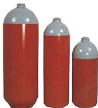
Art. 1710 Art. 1709 Art. 1708

Per pesi e dimensioni vedi tabella alla pagina precedente (bombole complete)