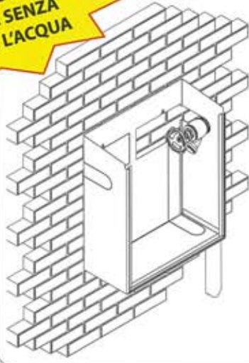
TUBO INSTALLATO ESTERNAMENTE

Togliendo le lamiere pretagliate sul lato e sul retro della cassetta la si può installare con la tubazione all'esterno della stessa senza dover smontare il rubinetto.